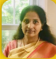
Anu Para Cultural Chair